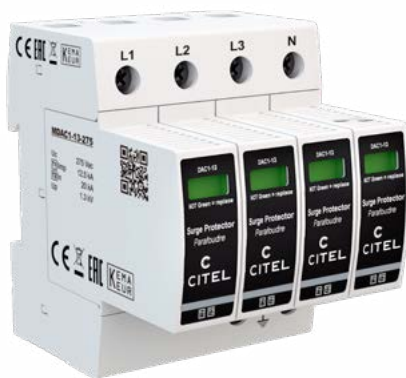
La protezione contro le sovratensioni protegge gli impianti elettrici e gli apparecchi ad essi collegati.