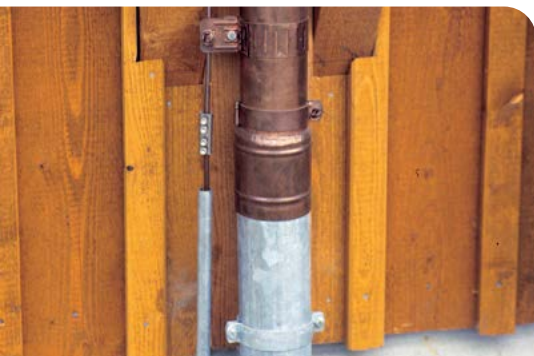
È necessario effettuare un controllo visivo periodico del sistema parafulmine e dei collegamenti.