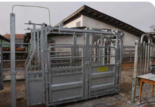
Collegamento equipotenziale tra gli elementi di un impianto di movimentazione e trattamento.