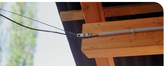
Linea di alimentazione della recinzione correttamente realizzata: cavi ad alta tensione posati in tubi difficilmente infiammabili. Per il passaggio all'aperto è stata tesa una fune metallica come supporto.