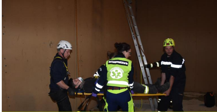
ÖFFENTLICHE HAND (BUND, KANTONE, GEMEINDEN)