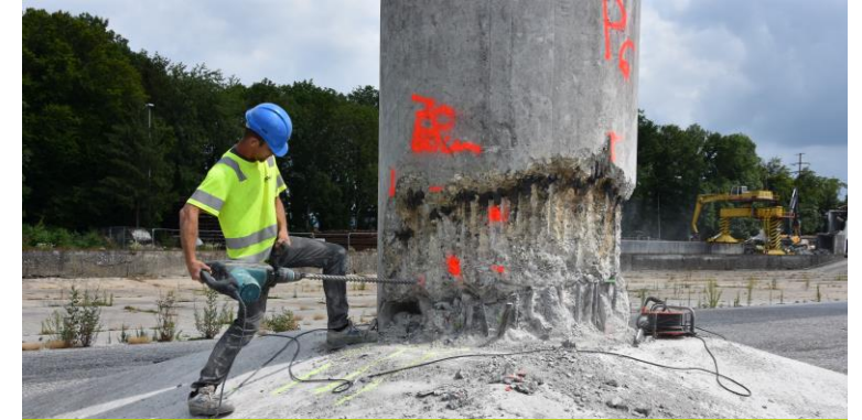
GEWERBE UND INDUSTRIE