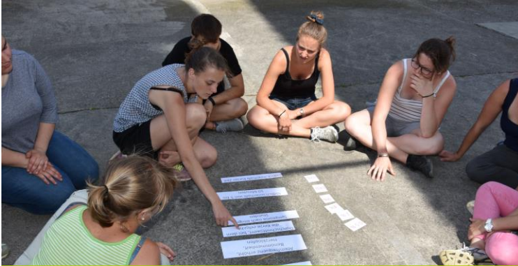
LANDW. INSTITUTIONEN (LBBZ, FORSCHUNG, HEIMBETRIEBE, JVA)